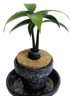
豆鉢 + 豆皿