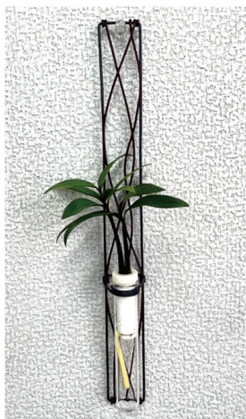
ブラックフレーム