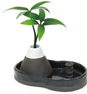
富士山 + 瓢箪型水盤器