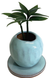
キューボラポット