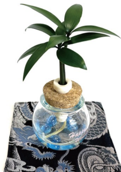
西陣金襴使用コースター