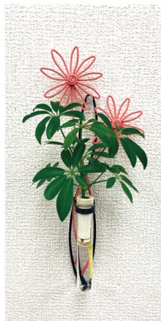
ワイヤーフラワー